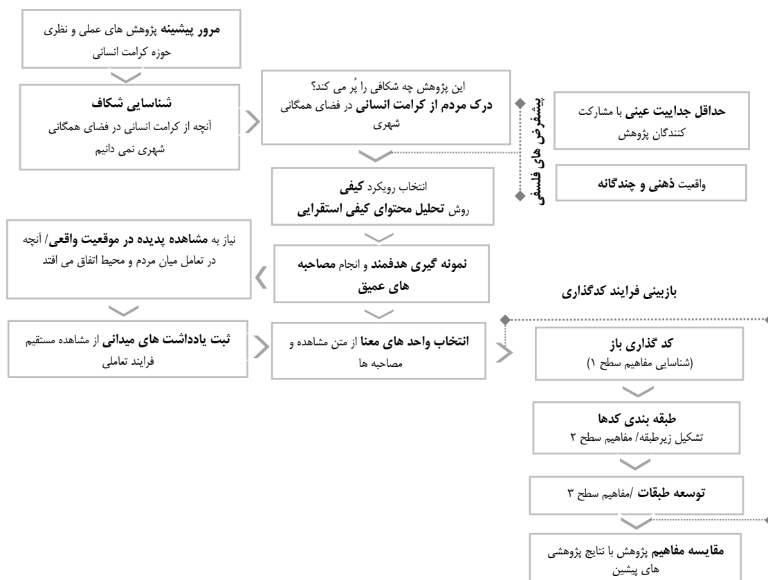
شکل (۱). فرآیند پژوهش

از میان مطالعات انجام شده در این حوزه می‌توان به مطالعه‌ی کااو ۲۰۱۹، اشاره کرد که به روابط اجتماعی و الگوهای استفاده از فضاهای همگانی شهری در انگلستان و چین اشاره کرد که به تجزیه و تحلیل الگوهای استفاده از فضای همگانی و انواع روابط اجتماعی می‌پردازد. داده‌های مشاهده شده‌ی این مطالعه از چهار فضای عمومی واقع در شزو چین و شفیلد انگلستان استخراج شده و ویژگی‌های شخصی کاربران، فعالیت‌های آن‌ها و نحوه اشغال فضای همگانی را مورد تحلیل قرار داده است. نتایج این مطالعه به اهمیت فضاهای همگانی برای انواع کاربران و نحوه‌ی استفاده از آن فضا و گروه‌های مختلف اجتماعی می‌پردازد. مطالعه دراوکوف ۲۰۱۹، به بازنگری مفهوم کرامت انسانی در عصر جدید می‌پردازد. در این مطالعه عزت نفس را یکی از مفاهیمی می‌داند که در چند دهه گذشته به طور چشمگیری تغییر کرده است. این مطالعه تلاش می‌کند که این مفهوم را از مخاطرات فناوری‌های جدید و امکان تهدید شأن انسانی مورد توجه قرار دهد.