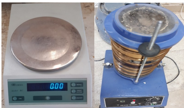
شکل (۳). دستگاه شیکر و ترازوی مورد استفاده جهت آنالیزها