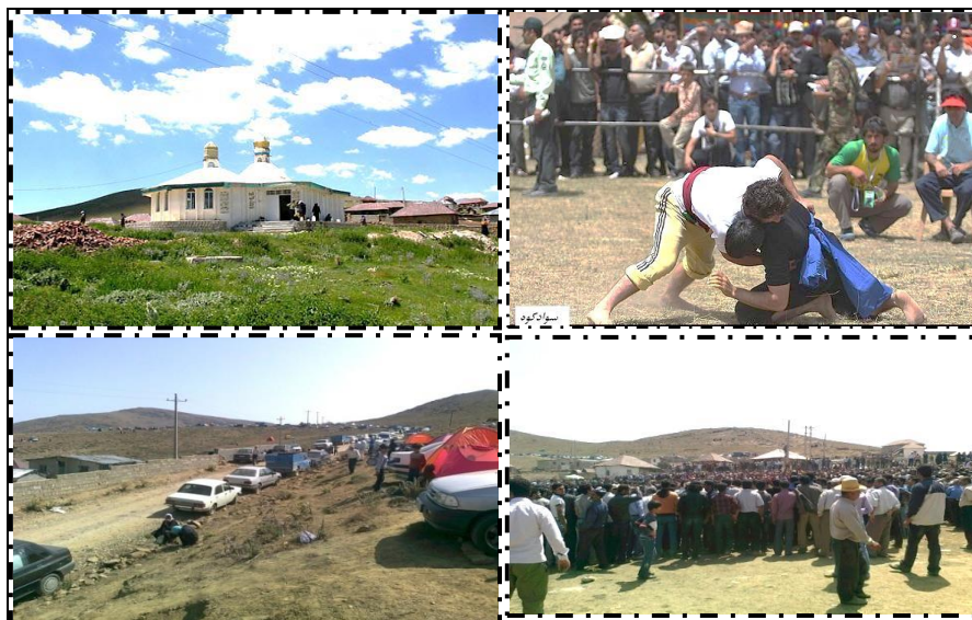
شکل (۱) نمایی از منطقه مورد پژوهش به همراه جمعیت و کشتی لوچو