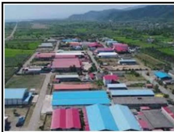
شکل (۳). چشم انداز شهرک صنعتی تالش

در این بعد، شهرک صنعتی تنها در دو معیار منظر و زیبایی، و پوشش سبز تأثیرات مثبت کم (نزدیک به متوسط) داشته و در شش معیار دیگر دارای تأثیرات منفی بوده است. به لحاظ پوشش سبز، با احداث شهرک صنعتی، بخشی از زمین های بایر به ساختمان و معبر و بخش قابل توجهی به درختکاری اختصاص داده شده است، از این رو تأثیر آن در ایجاد تاج سبز بیشتر در منطقه، مثبت تلقی شده است. فضای سبز مجموعه صنعتی نزدیک به ۱۰ هکتار می باشد (شهیدی، ۱۳۹۷). طراحی مجموعه صنعتی و منظره طرح و چشم انداز بیرونی آن از نگاه نمونه آماری هر چند در طیف کم (نزدیک به متوسط)، مثبت ارزیابی شده است شکل (۳).