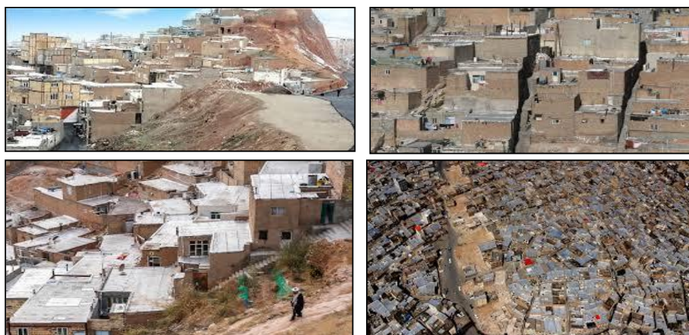
شکل (۲). تصاویری از سکونتگاه‌های غیررسمی شهر تبریز