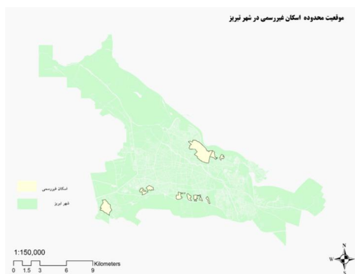
شکل (۱). موقعیت سکونتگاه‌های غیررسمی در شهر تبریز.

رواسان و آخماقیه حاشیه‌نشین محسوب می‌شوند. به لحاظ شرایط توپوگرافی، این محلات در شیب‌های بسیار تند واقع شده‌اند و بسیاری از آن‌ها دسترسی سواره ندارند و رفت‌وآمد از طریق پلکان انجام می‌گیرد. نداشتن سیستم فاضلاب و تأسیسات استاندارد از دیگر ویژگی‌های این محلات است. کیفیت مسکن این محلات بسیار پایین و حتی گاه با مصالحی چون خشت و گل می‌باشد. بافت متراکم و غالب مسکونی که بدون هیچ‌گونه فضای باز و سبز می‌باشد در این مناطق به چشم می‌خورد (شکل (۲)).