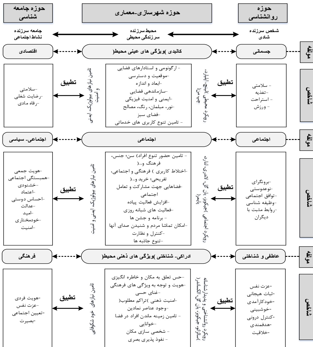
شکل (۷). مدل تحلیلی و تطبیقی ارزیابی سرزندگی محیطی