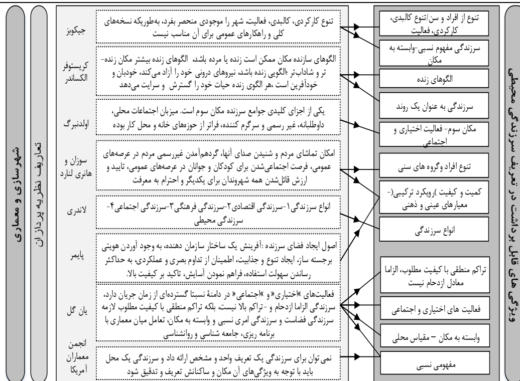
شکل (۴). ویژگی های قابل برداشت تعریف سرزندگی محیطی از نظریات شهرسازان و معماران