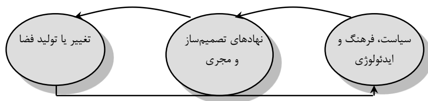
شکل (۱). رابطه سیاست و ایدئولوژی با تغییرات فضایی

در این راستا عناصر و محتوی فضای جغرافیایی در انضمام با نحوه تخصیص منابع و تبیین و چگونگی سیاست‌گذاری آن از سوی قدرت اجتماعی-سیاسی حاکم صورت می‌گیرد. در این راستا جغرافیدانان نسبت‌گرا متأثر از شناخت واقعیت‌های عملکرد سیاست و ایدئولوژی تبیین‌های استقرایی و جزئی را نافع تجویزات و غایت مطالعات اجتماعی ندانسته و در تحلیل فضایی به نقش قدرت در قالب اشکالی همچون گفتمان، ایدئولوژی و اقتصاد سیاسی توجه ویژه‌ای می‌نمایند. در این نگاه پرسش از چیستی گفتمان و سیاست پرسش از مجموعه‌ای از روابط درهم‌تنیده‌ای است که در کار شکل دادن به مناسباتی مرتبط با معنا بخشیدن و شکل دادن به فضای جغرافیایی می‌باشند. در چارچوب امر سیاسی ایدئولوژی، اقتصاد سیاسی و روابط اجتماعی به مدخلی برای شناخت فرم‌ها و فرایندهای فضایی در نظر گرفته می‌شود (تراکمه، ۱۳۹۳: ۲۶)؛ بنابراین هر چند هدف علوم جغرافیایی سازمان‌دهی فضایی در مقیاس‌های مختلف محلی، منطقه‌ای و ملی است. لیکن این سازمان‌دهی بدون لحاظ نمودن اثر هرکدام از سیاست‌های فضایی در ایجاد پراکندگی‌ها و افتراقات مکانی-فضایی ناکامل خواهد بود و فضا محصول نزاع میان «اتورپته‌های رقیب» بر سر دستیابی جهت سازمان‌دهی، اشغال و مدیریت می‌باشد.