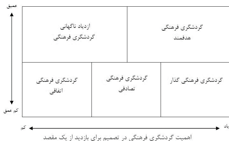
شکل (۳). گردشگری فرهنگی

تولید فرهنگی خواهد شد. شکل (۳). در این مدل، شاخص‌های مورد استفاده، تجربه عمیق و به دنبال آن اهمیت گردشگری فرهنگی در تصمیم برای بازدید از یک مقصد است.