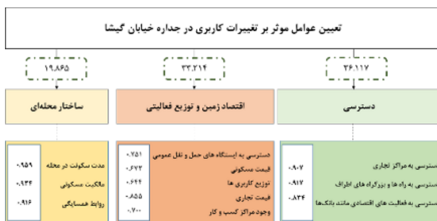
شکل (۲). مدل مفهومی منتج از بررسی مدل تحلیل عاملی در خیابان گیشا