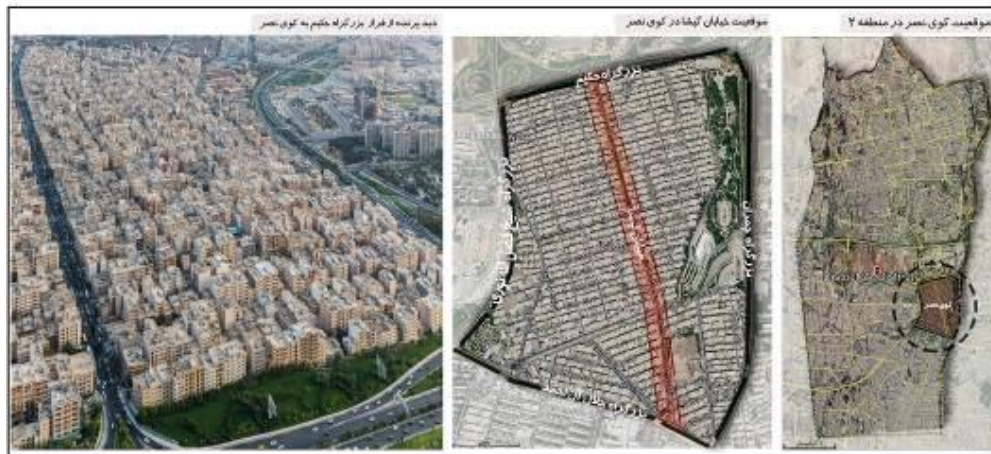
شکل (۱). نقشه معرفی محدوده خیابان گیشا

ساختار اصلی منظم و شطرنجی محله کوی نصر واقع در منطقه دو شهرداری تهران بر اساس خیابان گیشا شکل گرفته و غالب کاربری‌های تجاری محلی و فرامحلی در حاشیه این خیابان مکان یافته‌اند. خصلت تجاری غالب در این محور ۱۶۰۰ متری باعث شده که حضور مردم با فراغت و تفریح نیز همراه باشد و از این لحاظ خیابان گیشا نقشی فرامحله‌ای یابد. وجود کاربری‌های جاذب سفر در سطح منطقه و فرامنطقه (مجموعه برج میلاد، بوستان گفتگو، محل دائمی نمایشگاه‌های بین‌المللی شهرداری تهران و مرکز خرید گیشا) در نزدیکی این خیابان، سبب تمایز ساختار کالبدی و عملکردی آن شده است (آزادی و دیگران؛ ۱۳۹۶). شکل (۱) موقعیت خیابان گیشا را نشان می‌دهد.