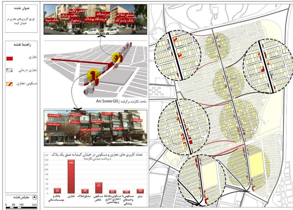
شکل (۳). نقشه توزیع و پراکندگی کاربری‌های تجاری در خیابان گیشا

به اندازه‌ای باشد که حضور ۲۳ بانک را توجیه کند. به منظور مشخص تر شدن وضعیت حضور بانک‌ها و مشاورین املاک در این خیابان، شکل (۵) در تشریح عامل دسترسی به مراکز مهم فعالیت اقتصادی ترسیم شده است.