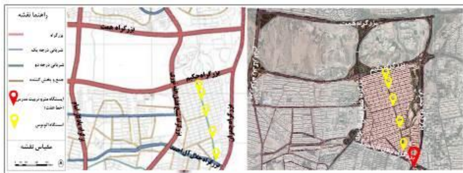
شکل (۴). نقشه مسیر دسترسی عمومی محدوده کوی نصر

شاخص دسترسی به مراکز حمل و نقل عمومی با بار عاملی ۰.۷۵۱ در عامل اقتصاد زمین و توزیع فعالیتی اثرگذار است. نقشه زیر مسیر دسترسی‌های مترو و اتوبوس محدوده کوی نصر را نشان می‌دهد. وجود ایستگاه‌های مترو و ایستگاه اتوبوس در کوی نصر و اطراف آن نشان از وضعیت مطلوب دسترسی در محدوده دارد. این شاخص با شاخص‌های قیمت مسکونی و تجاری در ارتباط است. به گونه‌ای که بهبود دسترسی و حمل و نقل عمومی در این محدوده می‌تواند سبب افزایش سفرها، افزایش حضور پذیری مردم و در نهایت عاملی تأثیرگذار در قیمت تجاری و مسکونی در این محله و توجیه‌پذیری افزایش فعالیت‌های اقتصادی و تغییر کاربری‌ها باشد.