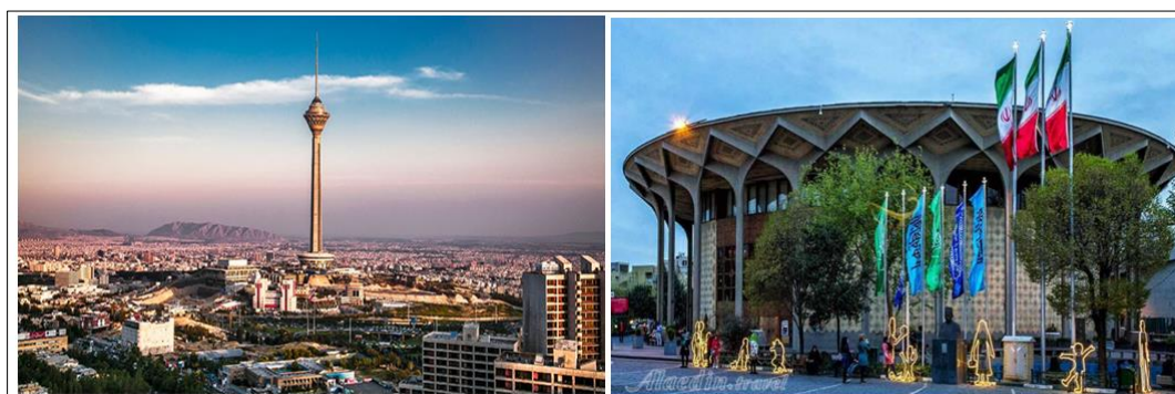
شکل (۳). جاذبه‌های شهر تهران (سمت راست: تصویر تئاتر شهر؛ سمت چپ: تصویر برج میلاد)