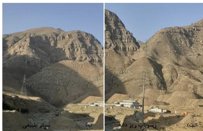
شکل (۱۱). الف) تصویر میدانی مسیر بازه ۸. ب) تصویر میدانی مسیر بازه ۹.

و مهم‌تر از همه که باعث شده است این دو بازه (بازه‌های ۸ و ۹) دارای کیفیت مورفولوژیکی متوسط باشند عدم وجود تغییرات مصنوعی و دخل و تصرفات انسانی در حریم این بخش از رودخانه می‌باشد.