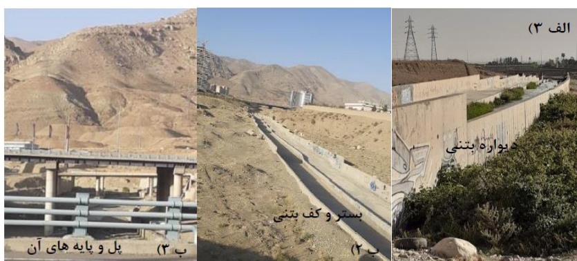
شکل (۹). ادامه: الف ۳) تصویر میدانی مسیر بازه ۶. ب ۲) و ب ۳) تصاویر میدانی مسیر بازه ۷.

بازه ۸ از ابتدای شهرک بالادست اتوبان شهید خرازی شروع شده و تا بعد از مناطق مسکونی امتداد دارد. از نظر شاخص عملکردی در این بازه پیوستگی طولی با تغییرات کم وجود دارد که جلوی عبور سیلاب را نمی‌گیرد و اشکال بستری سازگار با شیب دره هستند و دیواره‌های در اطراف رودخانه وجود ندارد و رسوبات ریزدانه فراوان در بخش‌های مختلفی از بازه وجود دارد و از نظر شاخص مصنوعی دارای تغییرات جریان و تغییرات دبی مشخصی می‌باشد و تغییرات مصنوعی در کمتر از ۱۰