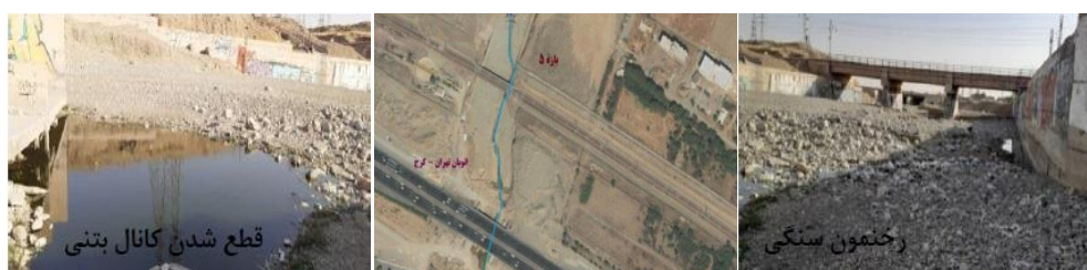
شکل (۸). تصاویر هوایی و میدانی مسیر بازه ۵

بازه ۶ از بالای خط متروی تهران- کرج شروع شده و تا بعد از اتوبان شهید همدانی امتداد دارد و بازه ۷ نیز از نرسیده به اتوبان شهید خرازی شروع شده و تا بعد از آن امتداد دارد. از نظر شاخص عملکردی در بازه‌های ۶ و ۷ پیوستگی طولی با تغییرات کم وجود دارد که جلوی عبور سیلاب را نمی‌گیرد و به دلیل وجود بستر مصنوعی دگرگونی کامل اشکال بستر و همچنین تغییرات رسوبات گسترده به صورت رخنمون‌های سنگی مشاهده می‌شود و همچنین دارای کانال به صورت دیواره بتنی می‌باشد و از نظر شاخص مصنوعی تغییرات جریان و تغییرات دبی قابل ملاحظه می‌باشد و همچنین تغییرات مصنوعی در مسیر رودخانه وجود دارد و از نظر شاخص تعدیل کانال در بازه‌های مورد ارزیابی تغییر الگوی کانال مشابه و تغییرات متوسط در عرض کانال و تغییرات محدود در سطح اساس بستر وجود دارد. بازه ۶ و ۷ از نظر کیفیت مورفولوژیکی (MQI) دارای امتیاز ۰/۲ و کیفیت خیلی ضعیف می‌باشد. در بازه ۷ با توجه به خطرات ناشی از وقوع سیلاب به دلیل تغییرات حریم و بستر و استقرار پل‌های بزرگراه شهید خرازی در حریم و بستر رودخانه، تأمین ایمنی پایه‌های پل به همراه ایجاد فضاهای سبز حائل بین رودخانه و شبکه بزرگراهی مهم‌ترین رویکردی است که در بازه شماره ۷ می‌توان لحاظ نمود شکل (۹).