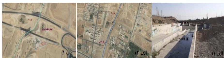
شکل (۹). الف ۱ و ۲): تصاویر میدانی و هوایی مسیر بازه ۶. ب ۱) تصویر هوایی مسیر بازه ۷.

بازه ۶ از بالای خط متروی تهران- کرج شروع شده و تا بعد از اتوبان شهید همدانی امتداد دارد و بازه ۷ نیز از نرسیده به اتوبان شهید خرازی شروع شده و تا بعد از آن امتداد دارد. از نظر شاخص عملکردی در بازه‌های ۶ و ۷ پیوستگی طولی با تغییرات کم وجود دارد که جلوی عبور سیلاب را نمی‌گیرد و به دلیل وجود بستر مصنوعی دگرگونی کامل اشکال بستر و همچنین تغییرات رسوبات گسترده به صورت رخنمون‌های سنگی مشاهده می‌شود و همچنین دارای کانال به صورت دیواره بتنی می‌باشد و از نظر شاخص مصنوعی تغییرات جریان و تغییرات دبی قابل ملاحظه می‌باشد و همچنین تغییرات مصنوعی در مسیر رودخانه وجود دارد و از نظر شاخص تعدیل کانال در بازه‌های مورد ارزیابی تغییر الگوی کانال مشابه و تغییرات متوسط در عرض کانال و تغییرات محدود در سطح اساس بستر وجود دارد. بازه ۶ و ۷ از نظر کیفیت مورفولوژیکی (MQI) دارای امتیاز ۰/۲ و کیفیت خیلی ضعیف می‌باشد. در بازه ۷ با توجه به خطرات ناشی از وقوع سیلاب به دلیل تغییرات حریم و بستر و استقرار پل‌های بزرگراه شهید خرازی در حریم و بستر رودخانه، تأمین ایمنی پایه‌های پل به همراه ایجاد فضاهای سبز حائل بین رودخانه و شبکه بزرگراهی مهم‌ترین رویکردی است که در بازه شماره ۷ می‌توان لحاظ نمود شکل (۹).