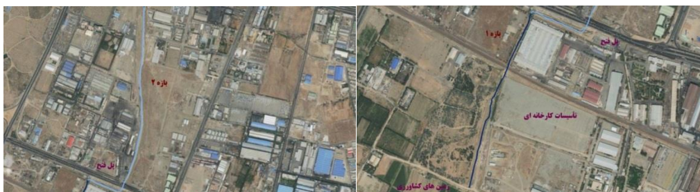
شکل (۴). تصویر هوایی مسیر بازه ۱