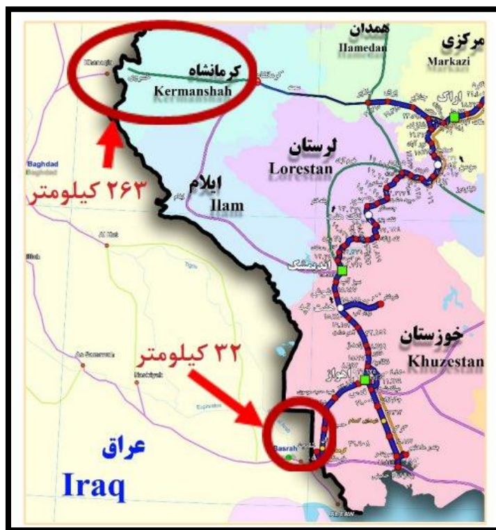
شکل ۶-مسیر ترانزیتی کرمانشاه _ بغداد منبع: رئیسی نژاد، ۱۴۰۰

در عوض شلمچه_بصره، ایران می‌توانست راه آهن کرمانشاه_بغداد را از مسیر قصرشیرین-خانقین راه اندازد چراکه دسترسی به پایتخت در کشوری ازهم‌گسیخته امری است خردمندانه. همچنین، ایران می‌توانست با توسعه خط سنندج_سلیمانیه از مرز باشماق، دسترسی زمینی ایمن به بازار کردستان عراق داشته باشد شکل (۶).