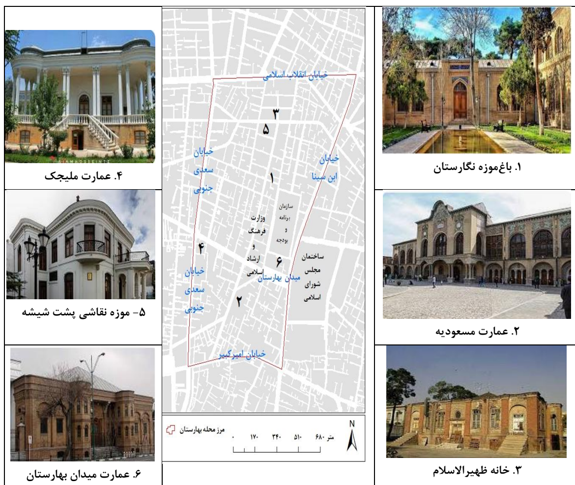
شکل (۲). موقعیت برخی از اماکن مهم و تاریخی محله بهارستان