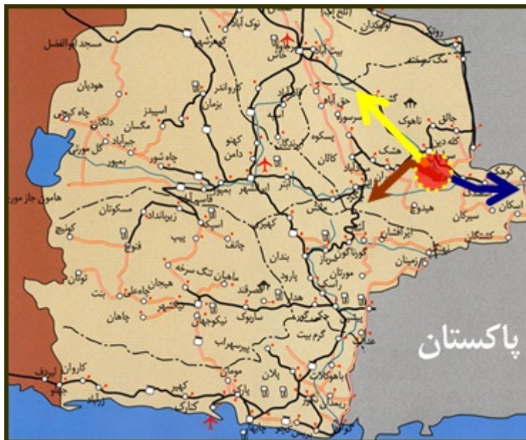
شکل (۲) نمایی از محورهای اصلی منطقه نمونه گردشگری کلپورگان با نواحی پیرامونی