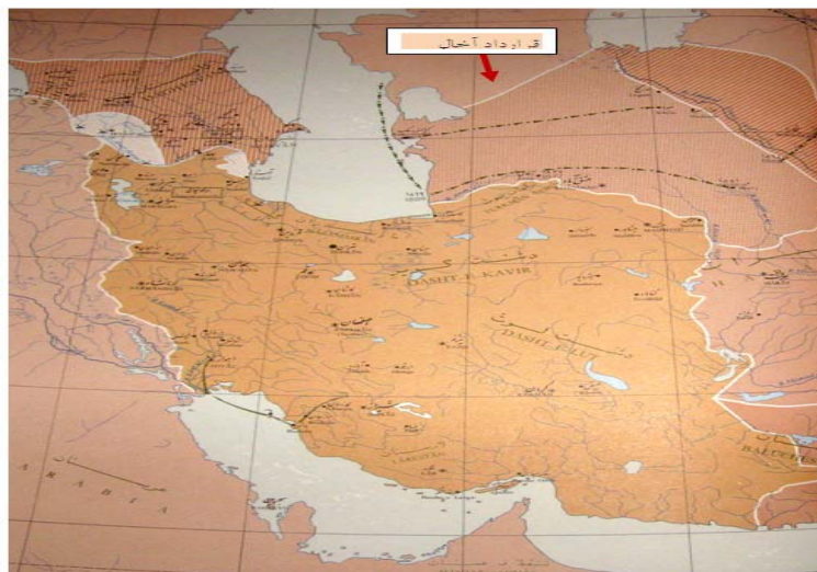
شکل (۱) نقشه سرزمین‌های جدا شده از ایران طبق قرارداد آخال (آخال - تکه) (موسسه جغرافیای دانشگاه تهران، ۱۳۵۰: ۲۸)

سال‌های ۱۸۷۳ تا ۱۸۸۱ علاوه بر اشغال خوارزم، ایلات ترکمن را نیز شکست داده بودند و سرزمین ترکمن‌های تکه را با نام «سرزمین ماورای خزر» به خاک خود ملزم کردند. با این پیمان ناصرالدین‌شاه حکومت روسیه را بر این مناطق به رسمیت شناخت و ایران و روسیه برای اولین بار در ناحیه شرق دریای خزر با یکدیگر همسایه شدند. پیمان آخال تأثیر دوگانه‌ای بر ایران داشت. از یک سو ایران تا حدی از یورش‌های ترکمن‌ها رهایی می‌یافت اما این امر به بهای گران از دست رفتن سرزمین‌هایی به‌دست آمد که ناصرالدین‌شاه ادعای سلطنت بر آن‌ها داشت (میرحیدر، ۱۳۵۶: ص ۱۸۵). این پیمان همچنین به ضرر ایلات و عشایر ترکمن‌ها بود و با مصالح سنتی قوم ترکمن هم‌خوانی نداشت. میان آنان مرز کشی شده و در دو کشور جداگانه قرار می‌گرفتند و اتحاد آنان به هم می‌خورد. یموت‌های ایران که بر اساس موافقت‌نامه دو دولت هر سال برای چراندن گله‌های خود به آن سوی مرز کوچ می‌کردند باید به هر دو دولت مالیات می‌دادند و این موضوع مقامات روسی و ایرانی را در جمع‌آوری مالیات دچار مشکل کرده بود.