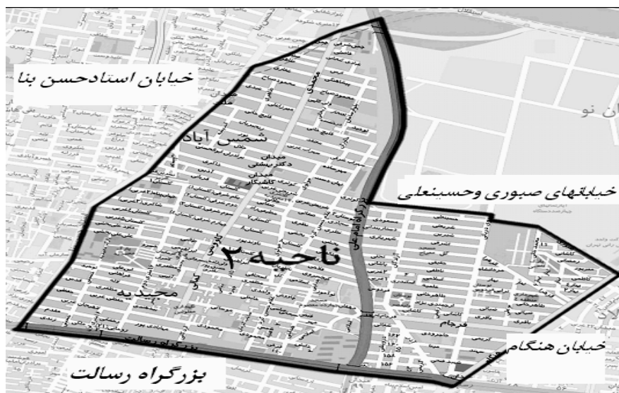
شکل (۱) مرز بندی ناحیه دو (محدوده مورد مطالعه)

این ناحیه متشکل از سه محله با ویژگی های متفاوت تیپولوژیک بوده و از این دیدگاه امکان مناسبی برای مقایسه را فراهم می آورد، به گونه ای که کالاد محله ای ساخته شده بر مبنای طرح و برنامه قبلی است، مجیدیه حاصل گسترش یک هسته روستایی در چهار دهه گذشته است و شمس آباد حاصل گسترش هسته روستایی در دوره اخیرتر است.