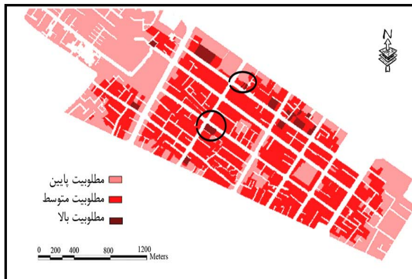
شکل (۳) سناریوی دوم: تلفیق و وزندهی لایه ها به روش Fuzzy AHP