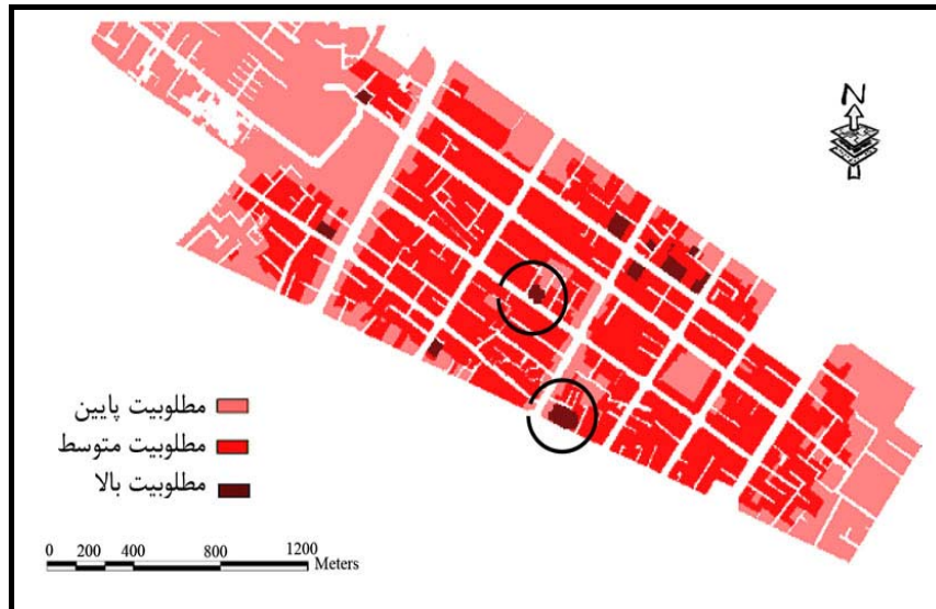
شکل (۵) سناریوی چهارم: تلفیق و وزندهی لایه ها به روش Structured AHP