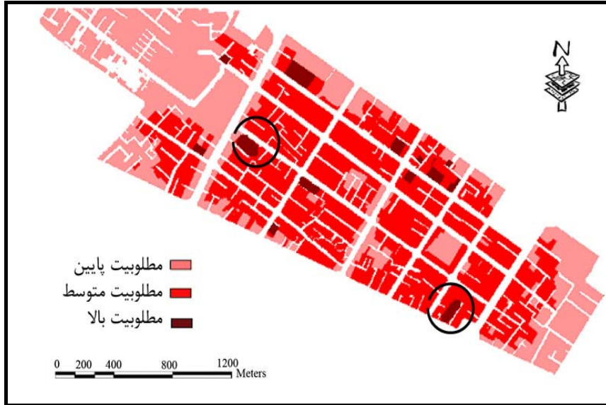
شکل (۴) سناریوی سوم: تلفیق و وزندهی لایه ها به روش AHP three- degree