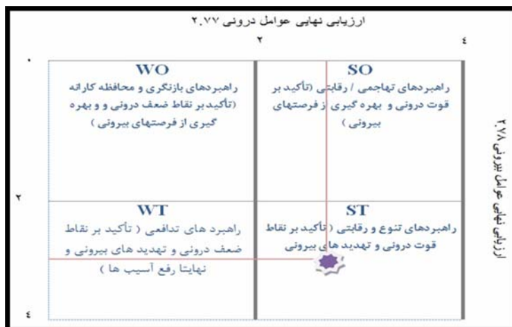
شکل (۲) ماتریس نمره نهایی ارزیابی عوامل داخلی و خارجی