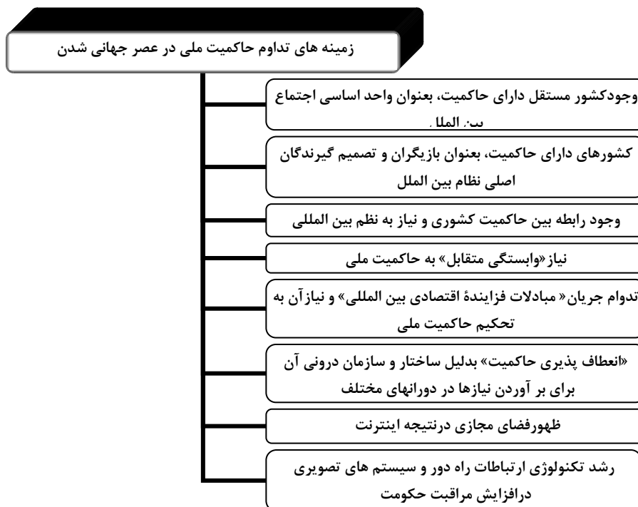
شکل (۲) زمینه های تداوم حاکمیت ملی در عصر جهانی شدن ( ترسیم از: نگارندگان)

همچنین، برخی مانند «تامسون» و «کراسنر» با زیر سوال بردن این ادعا که «وابستگی متقابل»، حاکمیت را تهدید می کند، استدلال می کنند که وابستگی متقابل به جای تهدید حاکمیت، خود نیازمند آن است. حکومت هایی دارای حاکمیت هستند که به تضمین و تثبیت حقوق مالکیت می پردازند و این خود، از شرایط لازم برای جریان بین المللی کالا و سرمایه است. مطابق با این استدلال، تحکیم حاکمیت خود از شرایط لازم برای جریان یافتن مبادلات فزاینده اقتصادی بین المللی است (Thomson and krasner, 1989: 197-198). «تامسون و کراسنر»، بر این اساس، هر گونه امکان بالقوه برای دگرگونی ساختاری عمده را که از پایین در رژیم حاکمیت رخ دهد، رد می کنند (Thomson and krasner, 1989: 216)، زیرا که وابستگی متقابل پیوسته نیازمند «تداوم» رژیم حاکمیت برای حفظ و پیگیری خود است. «کراسنر» در جای دیگر نیز همین استدلال اصلی را با تفصیلی بیشتر تکرار می کند. به نظر وی شواهد و سابقه تاریخی بسیار پیچیده تر از آن است که با تصور رایج درباره تهدید کنترل موثر حکومتی از جانب وابستگی متقابل مطابقت کند. بدین معنی که، کنترل موثر حکومتی به هر حال در