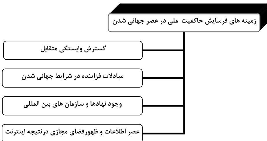
شکل (۳) زمینه های فرسایش حاکمیت ملی در عصر جهانی شدن (ترسیم از: نگارندگان)

قابل پیش بینی در جهت ایفای نقش خود به عنوان یک نهاد تأثیر گذار تداوم پیدا خواهد کرد. اما وجود یا فقدان حاکمیت به صورتی هر چه کمتر ویژگی تعیین کننده ساختار یا شیوه عمل دولت خواهد بود (کلارک، ۱۳۸۲: ۱۷۳). (شکل ۳)