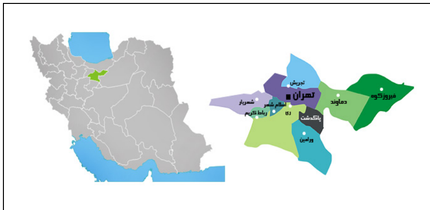
شکل (۱) موقعیت منطقه مورد مطالعه