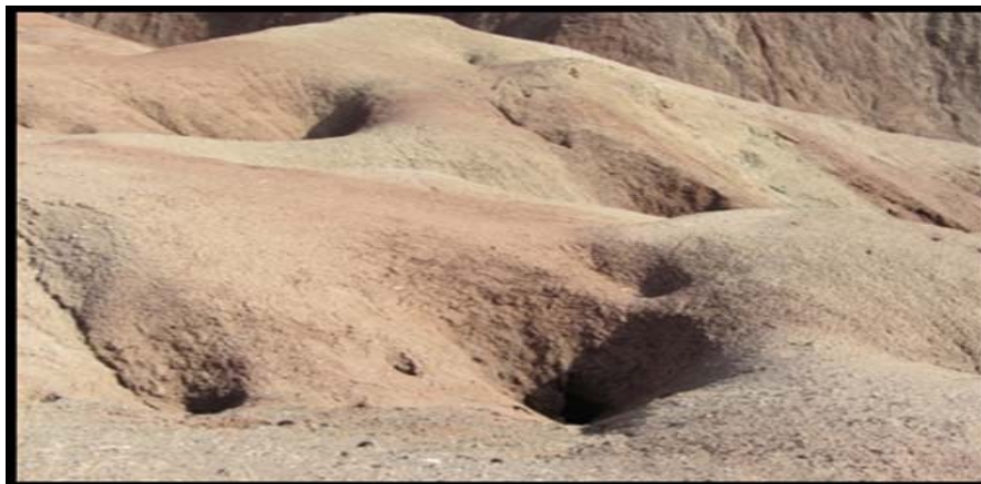
شکل (۷) پدیده پای پینگ در سطح گنبد‌های نمکی