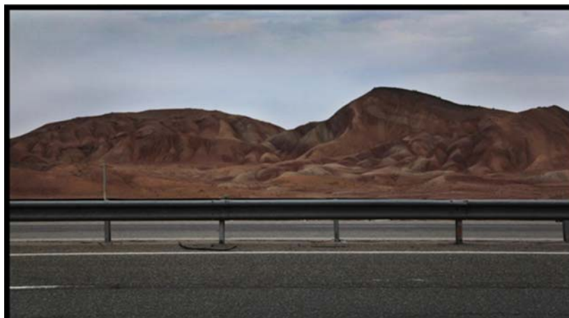
شکل (۵) گنبد نمکی نامنظم در مجاورت آزادراه قم- کاشان

جاذبه ها و قابلیت های گردشگری: آشنایی عموم گردشگران با پدیده های ژئومورفولوژیک و لندفرم های حاصل از تکتونیک نمکی نظیر پدیده پای پینگ و غیره؛ جاذبه های آموزشی (تخصصی) در زمینه شناخت تکتونیک، ماگماتیسیم، ژئومورفولوژی ساختمانی و غیره.