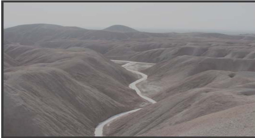
شکل (۶) رودخانه‌ی فصلی شور در دامنه‌های پشت به جاده