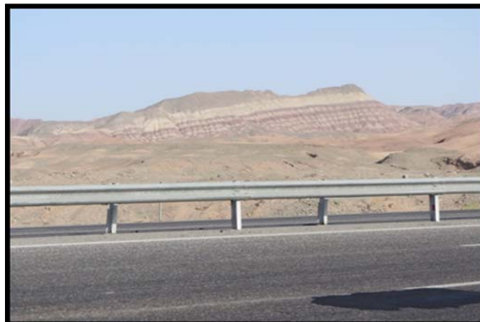
شکل (۲) اشکال چین خورده ترشیاری در تشکیلات تبخیری