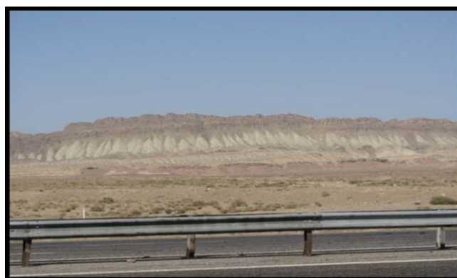
شکل (۳) بدلند و شیب های واریزه ای پیوسته در مجاورت آزاد راه قم - کاشان

جاذبه ها و قابلیت های گردشگری: جاذبه های آموزشی از منطقه علاوه بر مشاهده ی زیبایی چشم اندازها، در زمینه شناسخت فرایندهای دامنه ای از نمونه توان های ژئومورفوتوریستی این سایت می باشد.