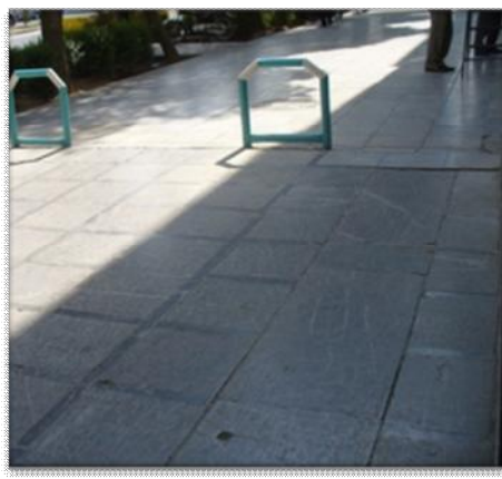
شکل (۳) مسیر عابر پیاده مطلوب و نامطلوب در محورهای انتخابی