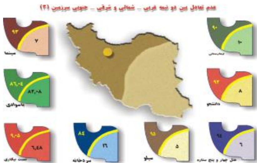
شکل (۲): نابرابری در مناطق مختلف کشور (ماخذ: صرافی، ۱۳۹۴: ۱۲)

سطوح توسعه یافتگی استانهای کشور از ۱۳۴۵ تا ۱۳۹۰