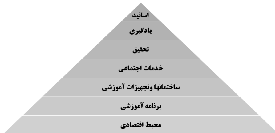
شکل (۱). ابعاد کیفیت خدمات آموزشی