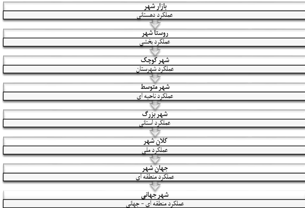
شکل (۲). انواع شهر از نظر اندازه و عملکرد فضایی

جغرافیدانان، شهر را محل تمرکز جمعیت، ابزار تولید، سرمایه، نیازها و احتیاجات و غیره می دانند که تقسیم کار اجتماعی نیز در آنجا صورت گرفته است و شهر را منظره‌ای مصنوعی از خیابانها، ساختمانها، دستگاهها و بناهایی می دانند که زندگی را امکان پذیر می‌سازد. بنابراین، شهر ترکیبی از عناصر مادی (مدنیت) و غیر مادی (اخلاقی) است که بخش دوم مهمتر است. (ربانی، ۱۳۸۷: ۱-۳).