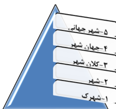
شکل (۱). انواع و مراحل تکامل شهر،