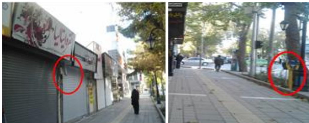
شکل (۵) مکان یابی کابین ها، کیوسکها در معابر پیاده

ایجاد هرگونه اختلاف سطح (لبه، پله، سکو و ...) در مسیر عبور در معابر پیاده ممنوع است و تغییرات سطوح بایستی بوسیله شیب راهه و رمپ انجام شود. شکل (۶).