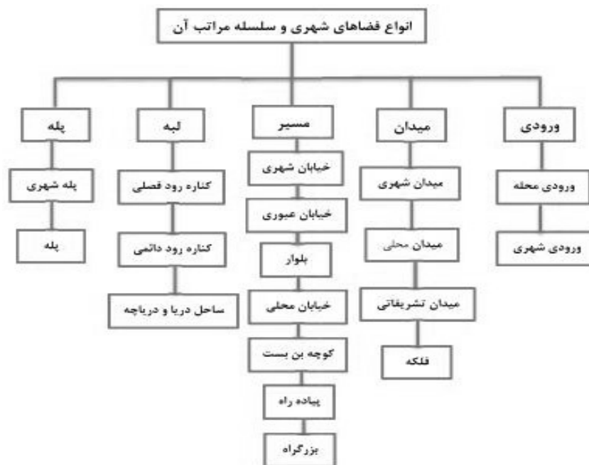
شکل (۱). انواع فضاهای شهری و سلسله مراتب آن