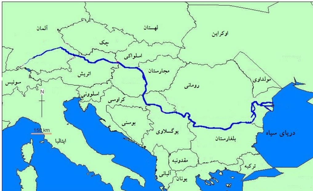
شکل (۲). موقعیت رودخانه دانوب در قاره اروپا

است (ووکویچ، ۲۰۱۴: ۳۲۵). از سویی بهبود وضعیت کانال کشتیرانی دانوب که امروزه به وسیله کانال به «ماین» و از آنجا به «راین» می‌پیوندد به این رود اجازه می‌دهد که به شاهره کشتیرانی مهمی تبدیل شود که دریای شمال را به دریای سیاه متصل می‌کند (محمدعلی پور، ۱۳۹۴: ۱). شکل (۲).