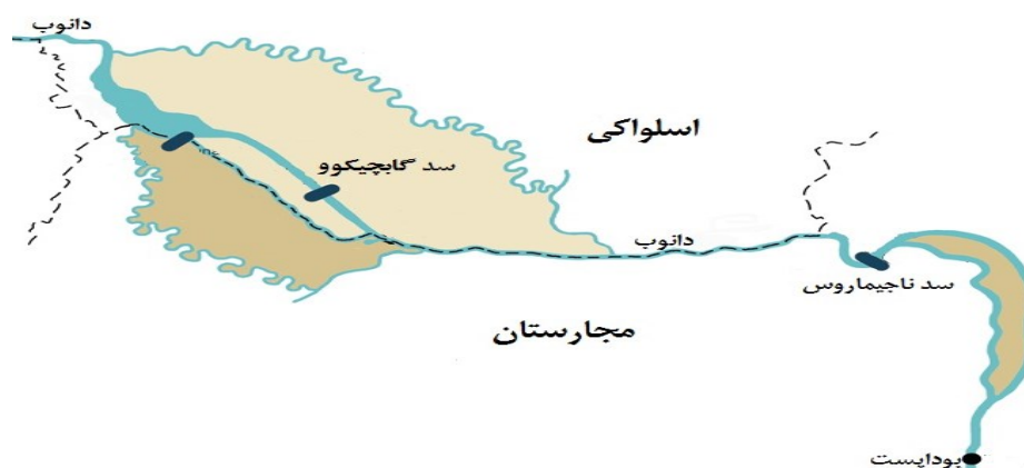
شکل (۳). موقعیت سدهای گابچیکوو-ناگیماروس بر روی رودخانه دانوب

اسلواک‌ها مسیر دانوب را از طریق یک کانال به نیروگاه "گابچیکوو" منحرف کردند. اقدامی که موجب شد بستر اصلی دانوب در خاک مجارستان یک‌باره ۹۰ تا ۹۵ درصد از آب خود را از دست بدهد. به‌طوری که تیرک‌های شاخص سطح آب، در خشکی قرار گرفت و سطح سفره‌های آب زیرزمینی دو-سه متر افت کرد (مولدوا، ۱۳۸۴: ۲۶). مجارهای تندروها از انفجار سد سخن راندند که به احتمال قوی باعث جنگ می‌شد که در این میان اتحادیه اروپا پیشنهاد میانجی‌گری داد. بر پایه برآوردها منفعت اتحادیه اروپا برای مداخله در این قضیه در ثبات منطقه نهفته بود. اتحادیه اروپا که نگران تکرار وقایع بالکان در این منطقه بود و بیم این می‌رفت که با آغاز درگیری افزون بر دخالت قدرت‌های فرامنطقه‌ای، ناامنی به کل منطقه بگسترده، پیشنهاد میانجی‌گری داد. با این حال، ایده میانجی‌گری در آغاز توسط طرف مجارستانی پشتیبانی نشد. چرا که مجارستان مسئله میانجی‌گری را منوط به رد «نسخه c» طرف اسلواکی می‌کرد (ووکویچ، ۲۰۱۴: ۳۳۶). شکل (۳).