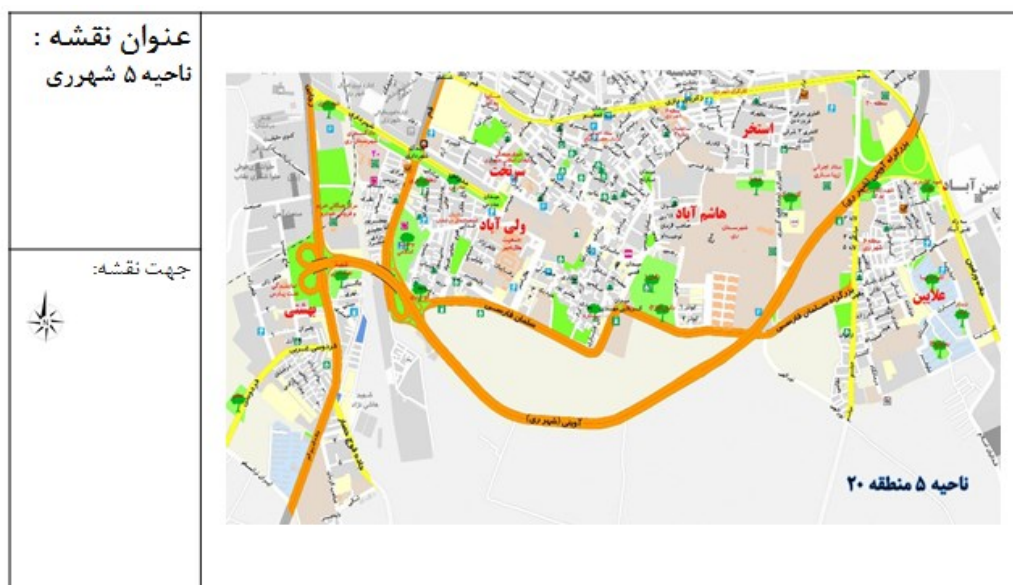
شکل (۲). منطقه مورد مطالعه، شهرداری منطقه ۲۰، ناحیه ۵ شهری

منطقه ۲۰ (شهری) جنوبی ترین منطقه شهری شهرداری تهران است. شهری محدوده ای است با مساحت ۲۲۹۳ کیلومتر مربع و با ۴۵۳۷۴۰ نفر جمعیت که از شمال به شهرستان تهران - از جنوب به شهرستان قم - از شرق به شهرستان ورامین و شهرستان پاکدشت و از غرب به شهرستان های اسلامشهر و رباط کریم محدود می شود. شهری در جنوب شرقی تهران و متصل به این شهر است. منطقه ی ۲۰ در حال حاضر دارای ۵ ناحیه خدمات رسانی شهرداری می باشد. (طرح تفصیلی منطقه ۲۰). از لحاظ تقسیمات شهرداری منطقه ۲۰ شهر تهران به ۷ ناحیه شهرداری و ۲۲ محله شهری تقسیم می شود. قلمرو مکانی پژوهش ناحیه ی ۵ شهری می باشد که از شمال به خیابان ۲۴ متری و سپاهیان انقلاب - از شرق به جنوب کمربندی ۴۵ متری و از غرب به خیابان قم و خط آهن تهران - مشهد محدود می شود. جمعیت این ناحیه ۵۱۵۹۹ نفر و مساحت آن ۸۱.۵ کیلومتر مربع می باشد. تعداد خانوار این ناحیه ۱۷۹۵۵ خانواده است. شکل (۲).