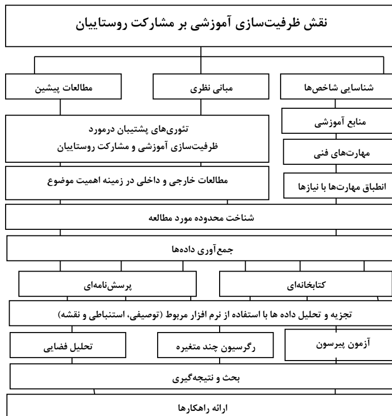
شکل (۳). فرآیند انجام پژوهش؛ ترسیم از نگارندگان

استفاده از نرم افزار SPSS، مورد تجزیه و تحلیل قرار گرفت. در نهایت با استفاده از نرم افزار ARC GIS اقدام به ترسیم نقشه و تحلیل فضایی روستاها از نظر میزان برخورداری از شاخص-های ظرفیت سازی آموزشی نموده است.