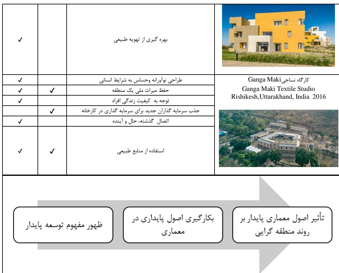
شکل (۳). فرایند تحول منطقه گرایبی پایدار

الکساندر زونیس و لیان لفور در آخرین چشم انداز خود در باب منطقه گرایبی، نمونه هایی از پروژه های اجرایی متفاوت در کشورهای مختلف دنیا را ذکر کرده و خاطر نشان می سازند که طی سال های واپسین قرن بیستم تا به امروز، تئوری معماری منطقه ای از منظرهای مختلف گرایش های زیادی گرفته و بسط یافته و با عملکرد خود نیز متناسب تر شده است. از تحلیل این آثار می توان به این نتیجه دست یافت که برخی از آثار منطقه گرایبی امروز از رویکرد پایداری تأثیر پذیرفته و دارای ویژگی های پایداری هستند. همچنین با بررسی سایر آثار که در مجلات و جوایز معماری که در سال های اخیر از آن ها با عنوان معماری منطقه گرا یاد شده می توان تاییدی بر نظریه زونیس و لفور در مورد ویژگی های منطقه گرایبی امروز باشد.