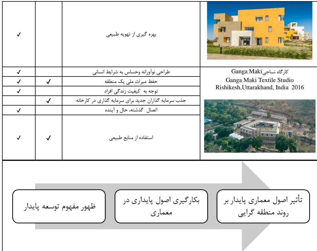
شکل (۳). فرایند تحول منطقه گرایبی پایدار

الکساندر زونیس و لیان لفور در آخرین چشم انداز خود در باب منطقه گرایبی، نمونه هایی از پروژه های اجرایی متفاوت در کشورهای مختلف دنیا را ذکر کرده و خاطر نشان می سازند که طی سال های واپسین قرن بیستم تا به امروز، تئوری معماری منطقه ای از منظرهای مختلف گرایش های زیادی گرفته و بسط یافته و با عملکرد خود نیز متناسب تر شده است. از تحلیل این آثار می توان به این نتیجه دست یافت که برخی از آثار منطقه گرایبی امروز از رویکرد پایداری تأثیر پذیرفته و دارای ویژگی های پایداری هستند. همچنین با بررسی سایر آثار که در مجلات و جوایز معماری که در سال های اخیر از آن ها با عنوان معماری منطقه گرا یاد شده می توان تاییدی بر نظریه زونیس و لفور در مورد ویژگی های منطقه گرایبی امروز باشد.