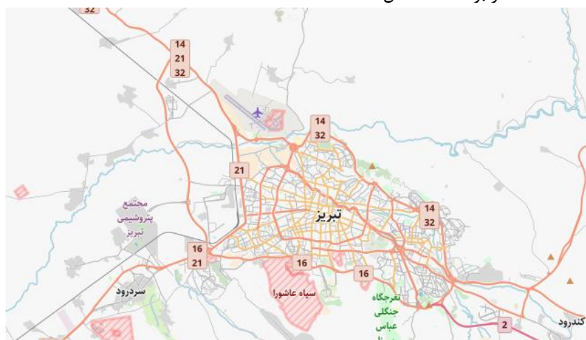
شکل (۱). موقعیت منطقه مورد مطالعه

محدوده مطالعاتی تحقیق حاضر شهر تبریز می‌باشد. کلان‌شهری در منطقه آذربایجان ایران و مرکز استان آذربایجان شرقی است. این شهر، بزرگ‌ترین قطب اقتصادی منطقه آذربایجان ایران و مرکز اداری، ارتباطی، بازرگانی، سیاسی، صنعتی، فرهنگی و نظامی این منطقه شناخته می‌شود. کلان‌شهر تبریز ۲۴۴/۵۱ کیلومترمربع وسعت دارد و جمعیت آن نیز در سال ۱۳۹۵ خورشیدی بالغ بر ۱۵۹۳۳۷۳ نفر بوده است شکل (۱).