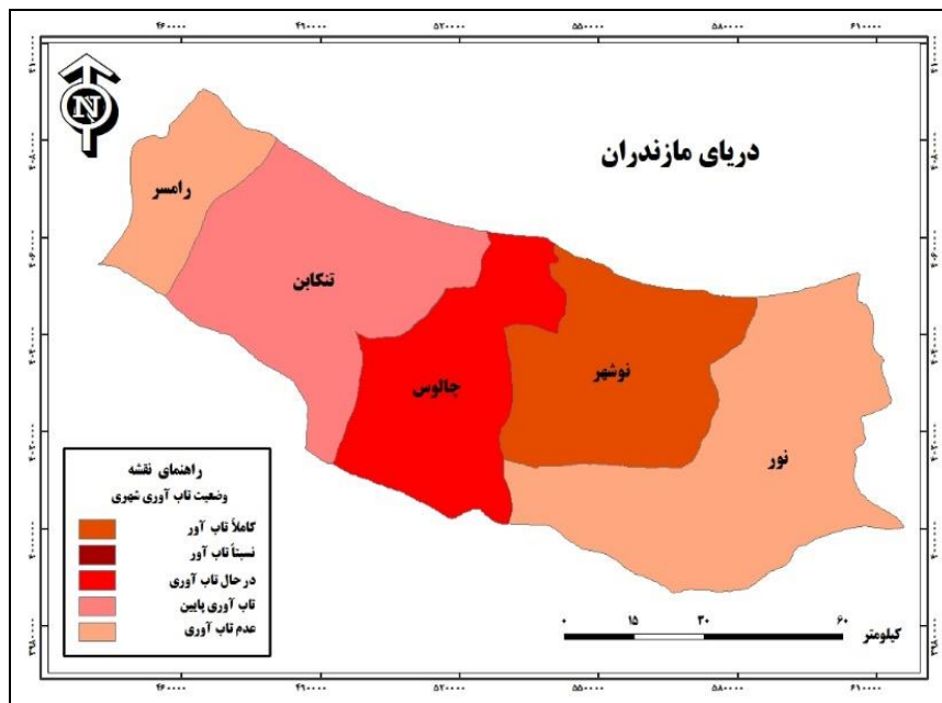
شکل (۲). نقشه شهرهای ساحلی غرب استان مازندران بر اساس وضعیت تاب آوری شهری

مقایسه شهرهای ساحلی غرب استان مازندران بر اساس وضعیت تاب آوری کالبدی-زیرساختی با استفاده از تکنیک ایداس