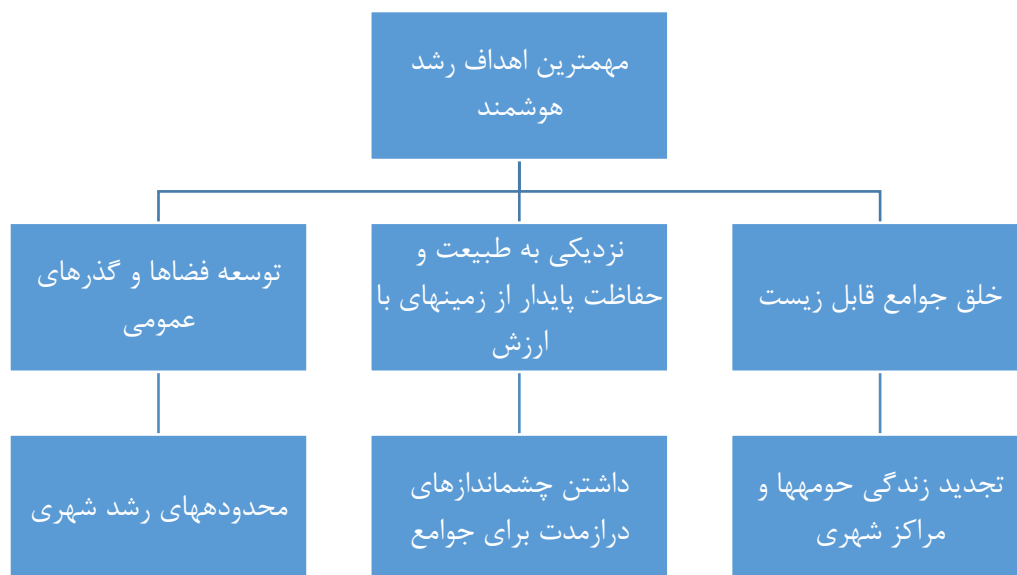
شکل (۱). مهم‌ترین اهداف شهر هوشمند (WWW.jhu.edu)