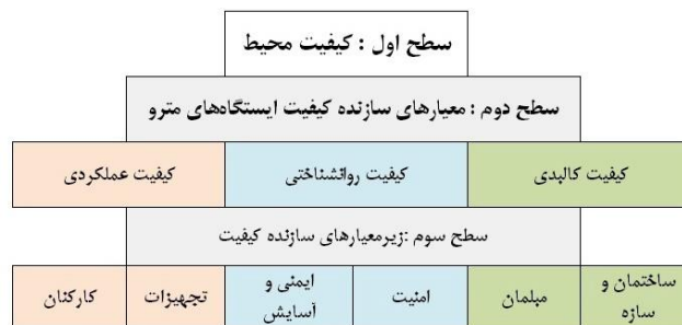
شکل (۲). مدل تجربی کیفیت محیطی ایستگاه‌های مترو

جهت دستیابی به اطلاعات ابتدا اسناد و مدارک، آمار و اطلاعات، متون فارسی، لاتین و ... از طریق مراجعه به کتابخانه، استفاده از نشریات تخصصی، منابع اینترنتی گردآوری شد. مدل تجربی سنجش کیفیت محیط دارای ساختاری سلسله‌مراتبی بوده و متشکل از معیارها و جزمعیارهایی است که در سطوح مختلف آن قرار می‌گیرند. در این جزمعیارهای سطح آخر مدل، مبنای تنظیم پرسشنامه تحقیق قرار گرفته و براساس میزان رضایتمندی یا نارضایتی ساکنین محیط موردنظر امتیازدهی می‌شوند. معیارهای اصلی جهت سنجش در سه دسته شامل معیارهای کالبدی و عملکردی و روان‌شناختی قرار گرفته که سطح دوم از معیارها را تشکیل می‌دهند. معیارها با استفاده از میزان رضایتمندی افراد و با استفاده از مدل‌های تحقیقات مشابه به‌دست آمده‌اند.