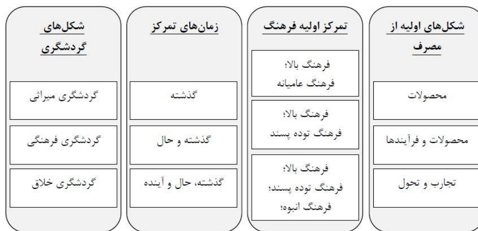
شکل (۲). ویژگی‌های گردشگری فرهنگی در کنار میراث فرهنگی و گردشگری خلاق

با این حال بیشتر موارد ذکر شده مبتنی بر محصول است (OECD, 2009)، به همین دلیل به هیچ طریقی نمی‌توان جلوی کالایی شدن فرهنگ را گرفت چرا که در اهمیت نقش محصولات فرهنگی در توسعه گردشگری جهت کسب سود بالاتر در مناطق مختلف هیچ شکی وجود ندارد. تجارب فرهنگی می‌تواند منجر به افزایش محصولات فرهنگی و همچنین جذب گردشگران جدید به منطقه شود که در این صورت جذب بازدیدکنندگان بر اساس عوامل انگیزشی مبتنی بر فرهنگ صورت می‌گیرد. گزارش سازمان همکاری اقتصادی و توسعه سازمانی در سال ۲۰۰۹ که نشان‌دهنده تأثیر فرهنگ بر روی گردشگری است، بیان می‌کند که گردشگری فرهنگی می‌تواند نقش عمده‌ای در توسعه مناطق مختلف، گرد هم آوردن مردم با سنت‌های متعدد و به اشتراک‌گذاری آداب و رسوم و ارزش‌ها داشته باشد. یکی از مهم‌ترین مشکلات در این زمینه از نظر راج این است که: اصطلاح «فرهنگ» به شدت در طول دو دهه گذشته مورد بحث قرار گرفته و هیچ تعریف روشن و مورد قبولی از مفهوم آن توسط جامعه به عنوان یک کل نشده است. این مورد ارتباط نزدیکی با هویت ملی ما دارد که مردم را در سازمان‌های اجتماعی، محلی و ملی مانند دولت‌های محلی، نهادهای آموزش و پرورش، جوامع مذهبی، کار و فراغت و تفریح قرار می‌دهد (Raj, 2012)؛ در نتیجه در چنین شرایطی چگونه فرهنگ می‌تواند یک ابزار و اهرمی در توسعه گردشگری محسوب شود. پس اولین گام در توسعه گردشگری فرهنگی در یک جامعه، تعریف روشنی از فرهنگ آن جامعه و محصولات فرهنگی آن است. رایج‌ترین روش صورت گرفته در برخورد با گردشگری فرهنگی کاهش ناملموس یک محصول در بازار و ایجاد تمایز بین محصولات و تبدیل آنها به محصولات مختلف و مرتبط با مفاهیم گردشگری میراث فرهنگی، گردشگری فرهنگی و گردشگری خلاق است. شکل (۲).