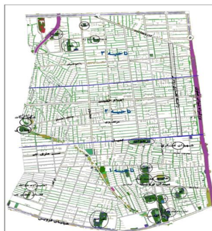
شکل (۲). موقعیت جغرافیایی منطقه ۱۰ در شهر تهران و فضاهای همگانی آن