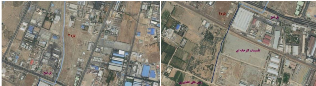
شکل (۴). تصویر هوایی مسیر بازه ۱