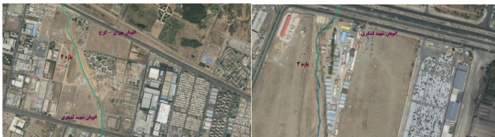
شکل (۶). تصویر هوایی مسیر بازه ۳

بازه ۴ از بالادست اتوبان شهید لشگری شروع شده و تا اتوبان تهران - کرج امتداد دارد. از نظر شاخص عملکردی در این بازه تغییرات قابل ملاحظه‌ای در پیوستگی طولی وجود دارد که از حرکت رسوب و چوب جلوگیری می‌کند و به دلیل وجود بستر مصنوعی دگرگونی کامل اشکال بستر و همچنین تغییرات رسوبات گسترده به صورت رخنمون‌های سنگی مشاهده می‌شود و دارای کانال به صورت دیواره بتنی می‌باشد و از نظر شاخص مصنوعی تغییرات جریان و تغییرات دبی قابل ملاحظه می‌باشد و همچنین تغییرات مصنوعی در مسیر رودخانه وجود دارد و از نظر شاخص تعدیل کانال در بازه مورد ارزیابی تغییر الگوی کانال مشابه و تغییرات متوسط در عرض کانال و تغییرات محدود در سطح اساس بستر وجود دارد. بازه ۴ از نظر کیفیت مورفولوژیکی (MQI) دارای امتیاز ۰/۲ و کیفیت خیلی ضعیف می‌باشد شکل (۷).