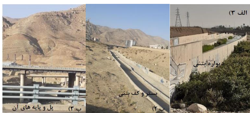
شکل (۹). ادامه: (الف ۳) تصویر میدانی مسیر بازه ۶. ب ۲ و ب ۳) تصاویر میدانی مسیر بازه ۷.

بازه ۸ از ابتدای شهرک بالادست اتوبان شهید خرازی شروع شده و تا بعد از مناطق مسکونی امتداد دارد. از نظر شاخص عملکردی در این بازه پیوستگی طولی با تغییرات کم وجود دارد که جلوی عبور سیلاب را نمی‌گیرد و اشکال بستری سازگار با شیب دره هستند و دیواره‌های در اطراف رودخانه وجود ندارد و رسوبات ریزدانه فراوان در بخش‌های مختلفی از بازه وجود دارد و از نظر شاخص مصنوعی دارای تغییرات جریان و تغییرات دبی مشخصی می‌باشد و تغییرات مصنوعی در کمتر از ۱۰