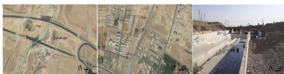
شکل (۹). (الف ۱ و الف ۲): تصاویر میدانی و هوایی مسیر بازه ۶. ب ۱) تصویر هوایی مسیر بازه ۷.

بازه ۶ از بالای خط متروی تهران- کرج شروع شده و تا بعد از اتوبان شهید همدانی امتداد دارد و بازه ۷ نیز از نرسیده به اتوبان شهید خرازی شروع شده و تا بعد از آن امتداد دارد. از نظر شاخص عملکردی در بازه‌های ۶ و ۷ پیوستگی طولی با تغییرات کم وجود دارد که جلوی عبور سیلاب را نمی‌گیرد و به دلیل وجود بستر مصنوعی دگرگونی کامل اشکال بستر و همچنین تغییرات رسوبات گسترده به صورت رخنمون‌های سنگی مشاهده می‌شود و همچنین دارای کانال به صورت دیواره بتنی می‌باشد و از نظر شاخص مصنوعی تغییرات جریان و تغییرات دبی قابل ملاحظه می‌باشد و همچنین تغییرات مصنوعی در مسیر رودخانه وجود دارد و از نظر شاخص تعدیل کانال در بازه‌های مورد ارزیابی تغییر الگوی کانال مشابه و تغییرات متوسط در عرض کانال و تغییرات محدود در سطح اساس بستر وجود دارد. بازه ۶ و ۷ از نظر کیفیت مورفولوژیکی (MQI) دارای امتیاز ۰/۲ و کیفیت خیلی ضعیف می‌باشد. در بازه ۷ با توجه به خطرات ناشی از وقوع سیلاب به دلیل تغییرات حریم و بستر و استقرار پل‌های بزرگراه شهید خرازی در حریم و بستر رودخانه، تأمین ایمنی پایه‌های پل به همراه ایجاد فضاهای سبز حائل بین رودخانه و شبکه بزرگراهی مهم‌ترین رویکردی است که در بازه شماره ۷ می‌توان لحاظ نمود شکل (۹).