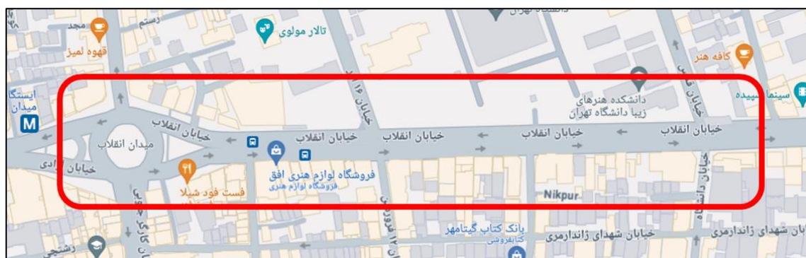
شکل (۱). محدوده مورد مطالعه در این پژوهش

خیابان انقلاب اسلامی یکی از خیابان‌های مهم و مرکزی شهر تهران است. (شکل ۱). این خیابان به علت واقع شدن دانشگاه تهران در کنار آن و نیز وجود فروشگاه‌های بزرگ کتاب و نشریات از خیابان‌های مهم تهران محسوب می‌گردد. محدوده مورد مطالعه این پژوهش، حدفاصل میدان انقلاب تا خیابان دانشگاه از این خیابان را شامل می‌شود که حال و هوای دانشگاهی و فرهنگی بر آن غالب است. لازم به ذکر است محدوده مورد مطالعه مشتمل بر بخش سواره‌رو و پیاده‌رو خیابان می‌باشد. طی پایش میدانی و مصاحبه با کاربران این محدوده مشخص گردید، بیشتر افراد از دانشجویان گرفته تا خریداران کتاب و مغازه‌داران و یا حتی رهگذران، بر عدم امنیت نسبی این خیابان اذعان دارند. ۶۲ درصد از افرادی که در مصاحبه مشارکت کردند، به وجود جرمی نظیر کیف‌چاپی، دزدی و مزاحمت خیابانی اشاره داشتند. شکل ۱ محدوده مورد مطالعه در پژوهش پایش رو را نشان می‌دهد. جداره شمالی این بخش از خیابان انقلاب در منطقه ۶ از مناطق ۲۲ گانه تهران و ضلع جنوبی آن جزء منطقه ۱۱ می‌باشد. وجود دانشگاه تهران به عنوان یک کاربری در مقیاس ملی و کتاب‌فروشی‌ها و انتشاراتی‌های مقابل آن سبب جذب جمعیت از سراسر ایران به این نقطه گشته و بر اهمیت این مکان می‌افزاید.