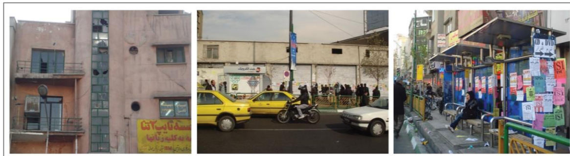
الف. وجود آلودگی های بصری فراوان، ب. وجود جداره های بدون فعالیت، ج. وجود پنجره شکل (۲). برخی از تصاویر حاصل از مشاهدات میدانی