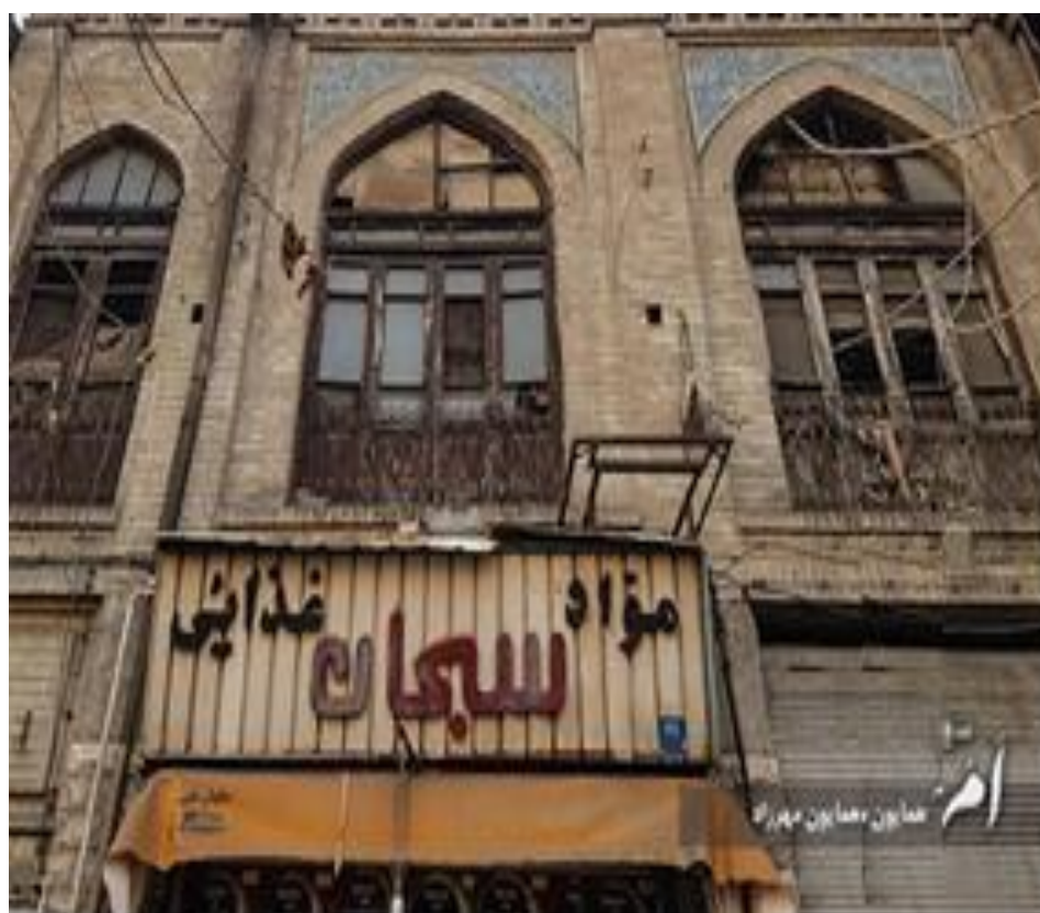
شکل (۳). نمونه‌هایی از اقدامات انسانی آسیب‌رسان در بافت تاریخی محله بهارستان