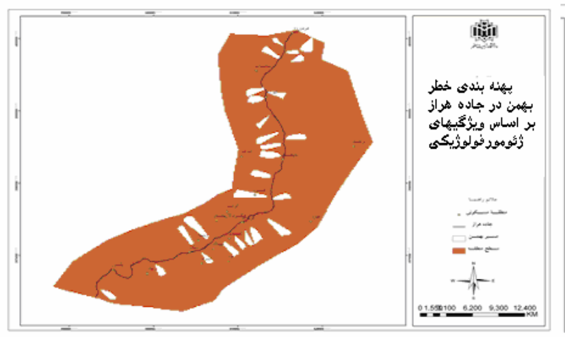
شکل شماره ۲ نقاط بهمن خیز مسلط بر جاده هراز (امام زاده هاشم تا هردورود

این نقشه را با استفاده از بازدیدهای میدانی و برداشت حدود ده نقطه توسط GPS از جاهایی که با توجه به معیارهای ژئومورفولوژیکی، اقلیمی، و شواهدی مبنی بر وجود تونل‌ها و بهمن‌گیرهای موجود، احتمال وقوع بهمن وجود داشت تهیه کرده‌ایم (شکل شماره ۲).