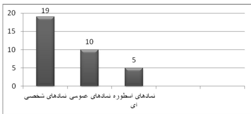
نمودار توزیع فراوانی نمادهای شعری اخوان ثالث در دهه سی