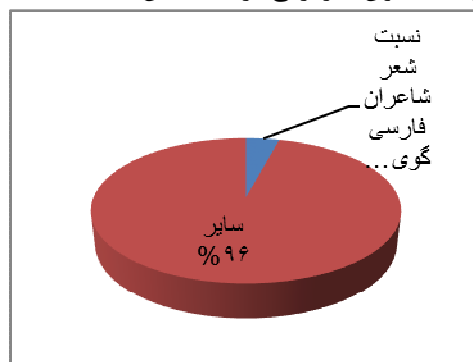
نمودار ۵. نسبت شعر شاعران فارسی‌گوی غیرایرانی به دیگر شاعران یغما

نمودار ۴ نشان می‌دهد که ۱۰ درصد اشعاری که در یغما به چاپ رسیده متعلق به یغمایی و بستگان اوست. البته، در این نمودار، فقط شاعرانی در نظر گرفته شده‌اند که نام خانوادگی‌شان یغمایی است و اگر دایرهٔ بستگان یغمایی را گسترده‌تر کنیم، بی‌شک این رقم افزایش خواهد یافت. موضوع دیگری که در زمینهٔ شاعران مجلهٔ یغما طرح کردنی است، حضور فعال شاعران فارسی‌زبان غیرایرانی در این مجله است. به‌گونه‌ای که نمودار ۳ نشان می‌دهد، شاعر افغانستانی خلیل‌الله خلیلی جزو ۲۵ شاعری است که بیشترین شعر از آنان در این مجله به چاپ رسیده است که دلیل این امر، استقبال یغما از چاپ شعر فارسی‌زبانان غیرایرانی است. در نمودار ۵، میزان مشارکت شاعران غیرایرانی در یغما نشان داده شده است.