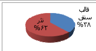
نمودار ۲. قالب ترجمه در یغما

میزان شعرهای ترجمه‌شدهٔ یغما نسبت به دیگر اشعار آن به یک‌درصد هم نمی‌رسد. از سوی دیگر، چنان‌که در نمودار ۲ نیز نشان داده شده است، ۳۸ درصد این اشعار در قالب‌های سنتی به فارسی برگردانده شده‌اند؛ بدین معنی که ترجمه، که همواره پیش‌درآمد نوگرایی در ادبیات بوده و به‌ویژه در مجله‌هایی چون سخن بستر نوگرایی به‌شمار رفته است، در یغما نادیده انگاشته شده و نقشی تفننی به‌عهده گرفته است و اگر توجهی هم به آن شده، از حیث معنایی بوده است، چنان‌که در اشعار ترجمه‌شده از پوشکین این ادعا تأیید می‌شود. حتی شاید بتوان ترجمهٔ اشعار خارجی در قالب‌های سنتی فارسی را از این‌باب تلقی کرد که یغما قصد دارد نشان دهد هدفش از ترجمه با هدف نوگرایان مغایرت دارد و آنچه برای این مجله مهم است، اثبات کارآمدی همه‌جانبهٔ قالب‌های شعر فارسی است که بر قامت ترجمه‌ها نیز راست می‌آیند.