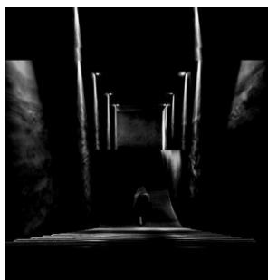
شکل ۲. شبیه‌سازی راه‌پله منتهی به دهلیز نمور در داستان شازده احتجاب

در داستان شازده احتجاب ، در پایان داستان، عنصر پله در کنار فضاهایی چون دهلیز و سردابه در خلق فضایی ابهام آمیز بین خواب و بیداری و مرگ و زندگی نقش مؤثری دارد. رمان شازده احتجاب با حرکت رو به پایین و نزولی شازده از پله‌ها و حضور در سردابه‌ای سرد و تاریک، که نشانه‌ای از مرگ و ناخودآگاهی است، به پایان می‌رسد. پله‌ها نمور و بی‌انتهای بود و شازده که می‌دانست نتوانسته است، که پدر بزرگ را نمی‌شود در پوستی جا داد، که فخر النساء... از آن همه پله پایین‌تر و پایین‌تر می‌رفت، از آن همه پله که به دهلیز نمور می‌رسید و به آن سردابه زمهریر و به شمد و خون و به آن چشم‌های خیره‌ای که بود و نبود (گلشیری، ۱۳۶۸: ۹۵).