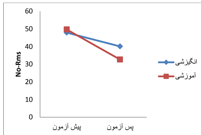
نمودار ۲. مقایسه No-Rms آرنج-میچ در دو گروه خودگفتاری آموزشی و انگیزشی

در بررسی تأثیر خودگفتاری آموزشی و انگیزشی بر دقت پرتاب آزاد بسکتبال، نتایج آزمون تحلیل واریانس با اندازه‌گیری مکرر نشان می‌دهد که اثر اصلی جلسات آزمون با p = /0.01 , F(1, 18) = 14.364 , \eta^2 = /444 معنی‌دار است. بنابراین مشخص است که اختلاف معنی‌داری بین نمرات دقت در پیش‌آزمون و پس‌آزمون وجود دارد و آزمودنی‌ها به طور معنی‌داری در پس‌آزمون بهتر از پیش‌آزمون عمل کرده‌اند. با توجه به معنی‌داری اثر اصلی جلسات آزمون، به منظور تعیین اثر هر یک از انواع خودگفتاری بر دقت پرتاب آزاد از آزمون t وابسته استفاده شد. در گروه خودگفتاری آموزشی نتایج آزمون t وابسته نشان داد که اختلاف بین میانگین‌های امتیاز دقت در دو مرحله به نفع پس‌آزمون معنی‌دار است و نشان می‌دهد که خودگفتاری آموزشی به طور معنی‌داری ( t = 4.388 , df = 9 , p = /0.02 ) بر دقت پرتاب آزاد بسکتبال تأثیرگذار است و موجب بهبود آن می‌شود. همچنین اندازه اثر ( d = 1/43 ) بزرگ و درخور توجه بوده است که نشان می‌دهد تأثیر خودگفتاری آموزشی بر دقت پرتاب آزاد بسکتبال زیاد است. اما در گروه خودگفتاری انگیزشی نتایج آزمون t