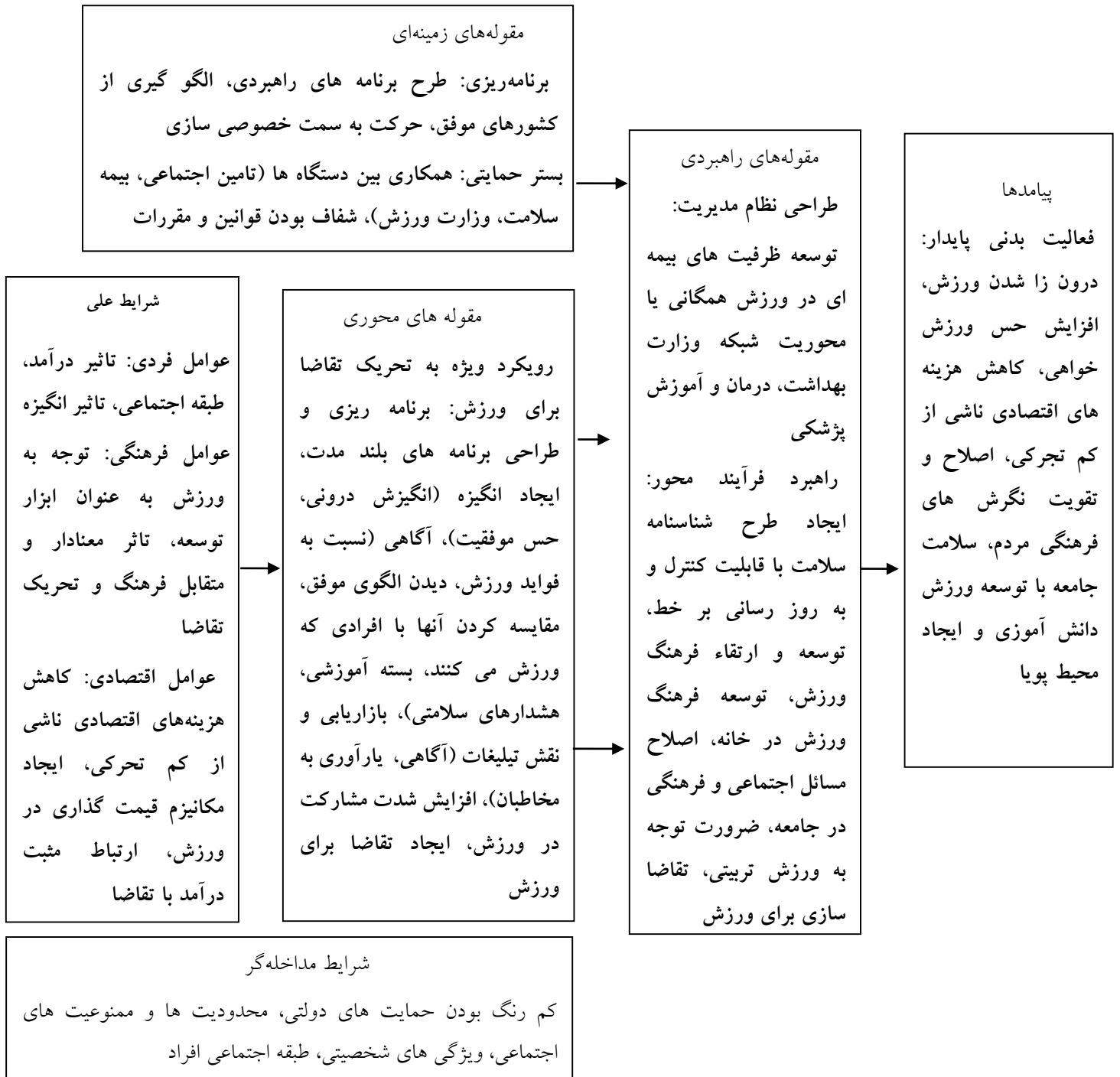
شکل ۱. الگوی تحریک تقاضا برای ورزش در جامعه ایرانی