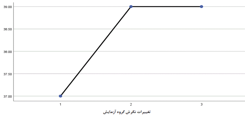
شکل شماره ۱. تغییرات نگرش گروه آزمایش پژوهش در سه مرحله پیش آزمون، پس آزمون و آزمون پیگیری

نتایج تحلیل واریانس با اندازه‌گیری‌های مکرر ارائه شده در جدول شماره ۶ حاکی از وجود تفاوتی معنی‌دار میان میانگین نمرات متغیرهای نگرش، دانش و رفتار مربیان حاضر در گروه آزمایش پژوهش در پیش آزمون، پس آزمون و آزمون پیگیری بوده است که نشان‌دهنده ماندگاری اثر آموزش مفاهیم حقوق ورزشی بر ارتقاء متغیرهای مذکور پس از گذشت ۱۲ هفته از اتمام مداخله آموزشی بوده است. این نتایج به صورتی دیگر در شکل‌های ۱ تا ۳ ارائه گردیده است.