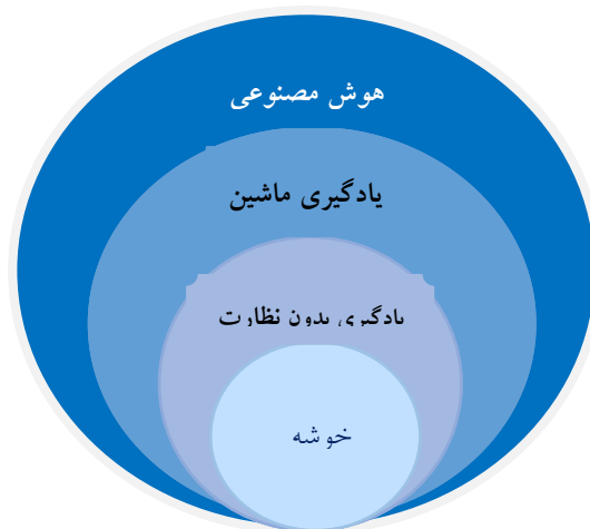
شکل ۱. جایگاه خوشه‌بندی، اقتباس از ویتن و همکاران ۲۰۱۷ (۱۲)

«خوشه‌بندی» ۱ یکی از تکنیک‌های علم یادگیری ماشین است که شامل گروه‌بندی نقاط داده می‌شود. با توجه به مجموعه‌ای از نقاط داده، می‌توان از یک الگوریتم خوشه‌بندی برای طبقه‌بندی هر نقطه داده به یک گروه خاص استفاده کرد. در تئوری، نقاط داده‌هایی که در یک گروه قرار دارند باید دارای خصوصیات و یا ویژگی‌های مشابه باشند، درحالی‌که نقاط داده در گروه‌های مختلف باید دارای خصوصیات و یا ویژگی‌های بی‌شبهت باشند. خوشه‌بندی حاصل در این پژوهش (شکل یک) محصول روش یادگیری ماشین، بدون نظارت است و یک روش معمول برای تجزیه و تحلیل داده‌های آماری است که در بسیاری از زمینه‌ها مورد استفاده قرار می‌گیرد. محققین با مشاهده و استخراج روابطی که از داده‌ها شکل گرفته می‌توانند اطلاعات ارزشمندی به دست آورند.