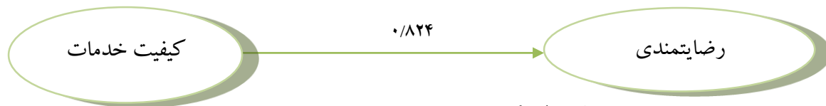
شکل ۱. تأثیر رگرسیونی متغیر کیفیت خدمات بر رضایتمندی

پروورش اندام در حد کم، ۴۶/۶ درصد در حد متوسط و ۴۲/۵ درصد در حد زیاد ارزیابی شده است. همچنین، نتایج نشان داد (شکل ۱ و جدول ۱) در مجموع، متغیر کیفیت خدمات پیش‌بین معناداری برای رضایتمندی مشتریان محسوب می‌شود ( p < 0.01 )، (\beta = 0.824) .